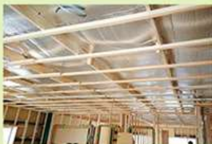
断熱シートを敷き込むことで暑さをシャットアウト。隙間も専用テープで完璧!