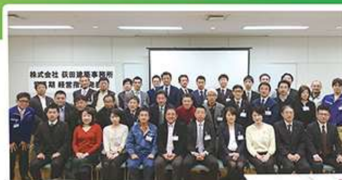
▲指針発表会は総勢40名、その後の懇親会にも多くの方にご参加いただきました！3月初旬というお忙しい中にも関わらずご参加いただいた皆様ありがとうございました！

これも皆様方のご支援とご愛顧によるものと、心から感謝申し上げます。今期も社員一同全力をもって取り組んでまいります。どうぞよろしくお願いたします!(尾)