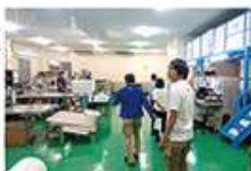
▲ちりひとつ落ちていない工場内