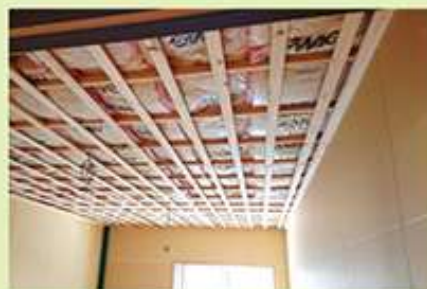
最後に断熱材も投入。これで快適な事務所になりました!