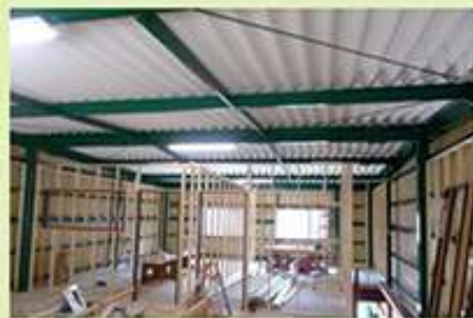
天井の折板屋根はこのままでは夏は焼けつくような暑さになってしまいます。