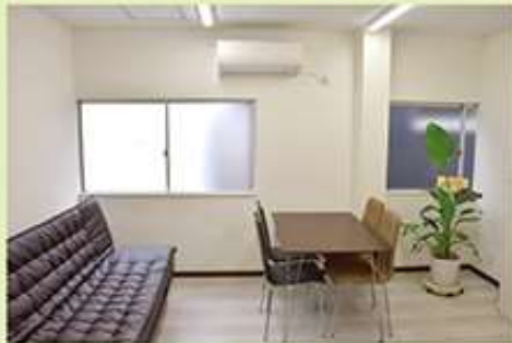
SK FACTORYでは標準となってきた断熱材を天井裏へ、快適温熱環境の社長室。