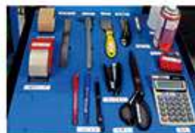
▲展示品のように整頓された道具