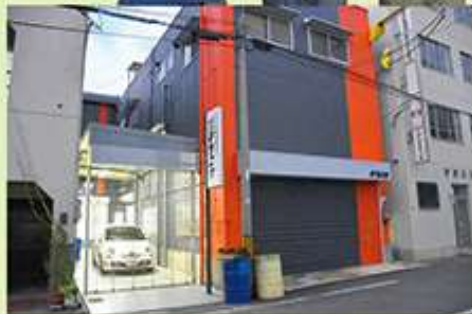
グリルシャッターを経て通路奥の開口が二様の工場の動線をスムーズにしています。

台風21号の影響を受けながらも約半年の工事を経て完成しました。HPを見ての電話問合せから約1年。新築のように生まれ変わった社屋で法人化され機械も増設し、新たな従業員さんも迎え活気ある工場となっています。