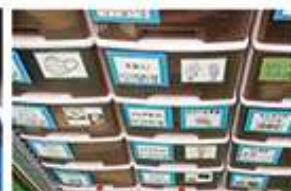
▲写真付きで一目でわかるBOX棚