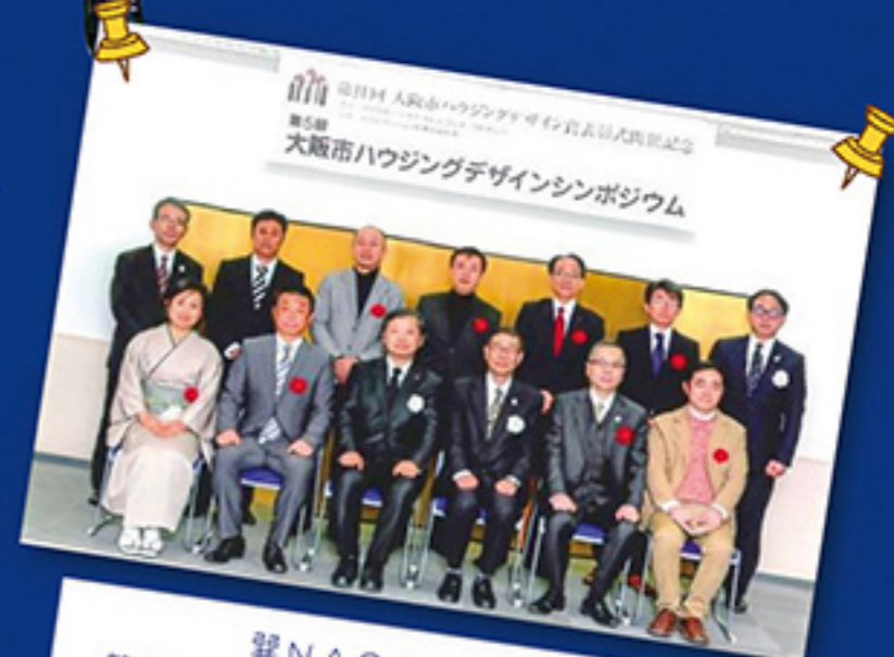
異NAGAYAが 第31回大阪市ハウジングデザイン賞 を受賞しました!

タテモノには、それぞれ使いみちがあります ヒトは、使いみちを考えてタテモノを建てます ヒトは、タテモノと付き合いながら成長し、 タテモノは、ヒトの想いをくみながらその役目を全うします 縦系はその「歴史」であり、横系はその「想い」でしょうか みなさん、どうか素晴らしいタテモノガタリを紡いでください